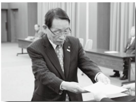
選挙管理委員会委員長より当選証書を手渡される

加えて、市の活性化対策として、平成23年に設立した『 ふるさと応援の会 』の拡大による、『 文化芸能・スポーツ・特産品の販売・企業誘致の推進 』、『 道の駅を活用した地域の活性化 』も推進していきます。また、本年3月に国史跡に指定された『 甲立古墳 』の整備計画を策定し、市の観光資源として活用していきます。