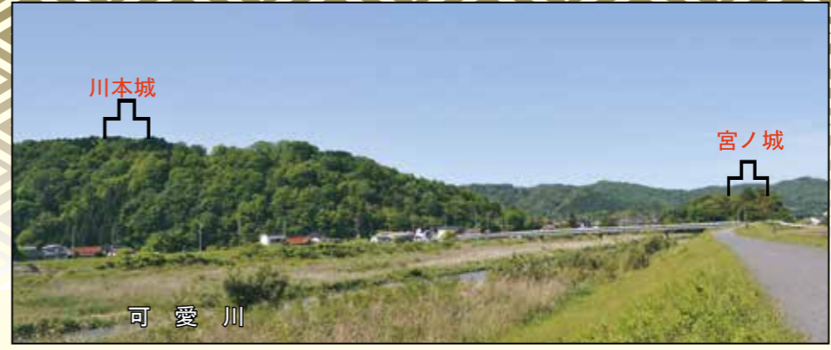
川本城・宮ノ城遠望(南側より撮影)