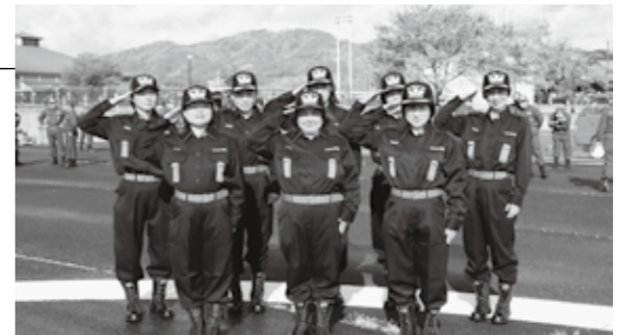
4月17日安芸高田市消防ヘリポートにて辞令交付式