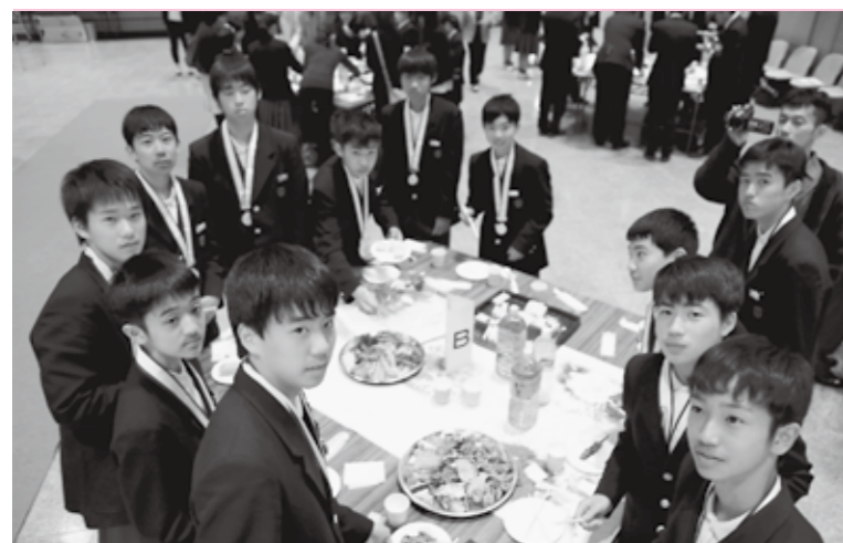
甲田文化センターで行われた祝賀会の様子

小学校のとき、いこの練習を見に行ったことがきっかけで、ハンドボールをはじめました。シュート、特にジャンプシュートが決まると最高に楽しいです。逆に、練習でシュートが決まらないときは、シャトルランなど体力強化を重点的に行います。練習の量も多いのでつらいときもあります。今回の大会は、チームワークと甲田中の速攻が全国に通じた結果、優勝できたと思います。試合中は、他の選手の動きをしっかり見て、調子のいい選手に多くパスをまわすことができました。これからも、ハンドボールを続けていきたいと思っています。