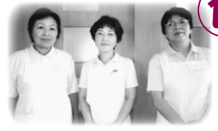
安芸高田市食生活改善推進協議会 甲田支部