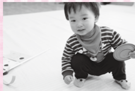
吉田幼稚園園庭開放にて、お皿を広報係のカメラマンへ持ってきてくれた笑顔の男の子

※きょうだいでのご参加の方は、託児もあります。 ※参加希望の方は、保健医療課へお申し込みください。 受付時間は8:30~17:00、土日祝は除く Email: sukusuku@city.akitakata.lg.jp (メールで送られる場合は、件名に「すくすく離乳食教室申込み」と入力して、本文にお子さんの名前、月齢、町名、アレルギーの有無、きょうだいの参加有無(有の方は、名前、年齢)を入力してください。)