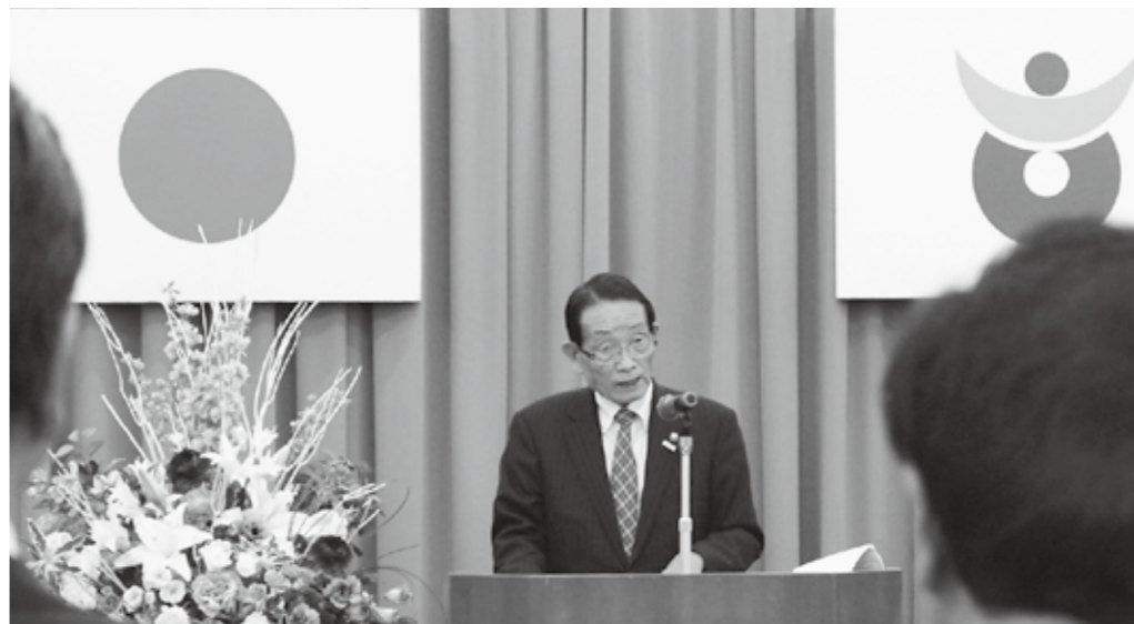
浜田市長、職員の前で力強く訓示をする

これら様々な取り組みにより、合併後における六町の速やかな一体化が着実に図られてきたように感じており、地域の個性を活かした新市の均衡ある発展と、住民の福祉の向上にも繋がったものと確信しています。