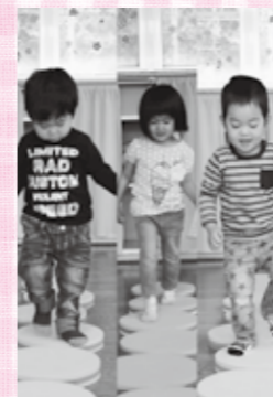
吉田幼稚園園庭開放にて、歩くの鳴るおもちゃで遊ぶ3人の子供達