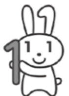
マイナンバー・キャラクター「マイナちゃん」