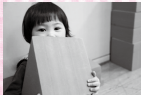
吉田幼稚園園庭開放にて、大きな積み木を片付けている女の子