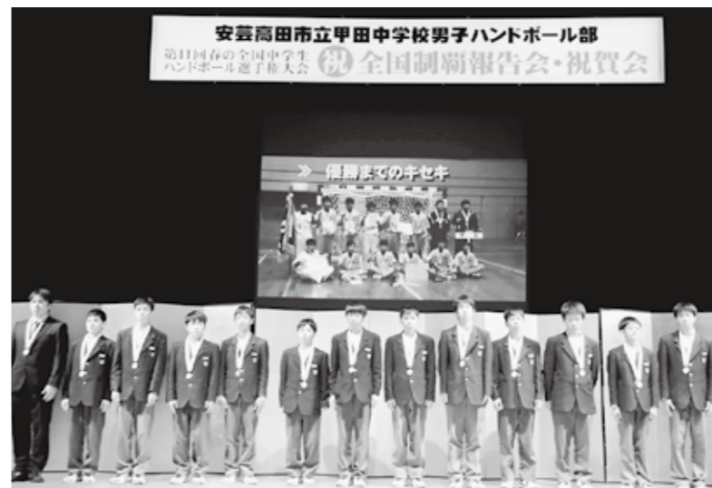
甲田文化センターで行われた祝賀会の様子

夏の全国大会で好成績を目標にしています。地域に根差した湧永製薬さんとも連携を図りながら、練習も増やしていきたいと考えています。この目標のために、今の選手たちが誰一人欠けてもいけません。みんな一人ひとり大事な役割を持っています。保護者のみなさん、地域のみなさんにも支えられて、さらに成長していく子どもたちに期待してください。