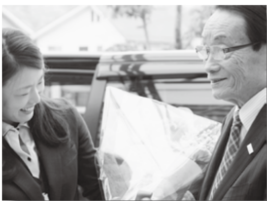
4月18日（月）初登庁 クリスタルアージュ正面玄関前で多くの職員に出向かえられる中、お祝いの花束を受け取る

高齢者福祉に対する支援力を注いできましたが、人口減少に歯止めが掛からないという厳しい現状となっています。