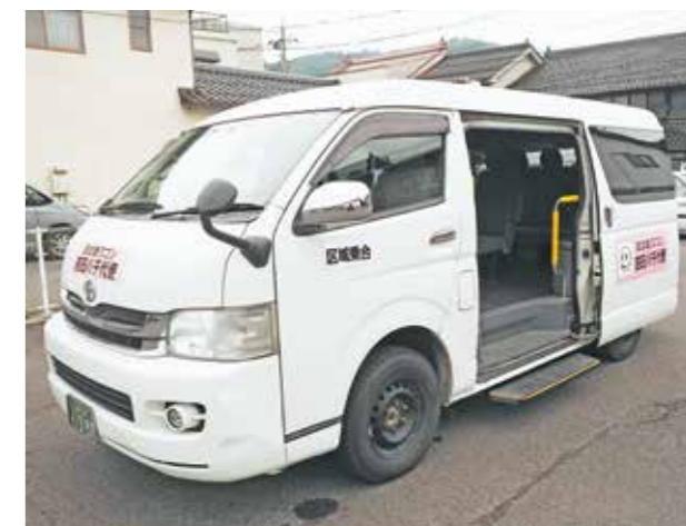
スライドステップや手すり付きで乗り降り楽々。子どもから高齢の方まで、安心して利用できる移動手段として定着しています

平成22年10月から市内全域の運行を開始し、年間延べ4万人が利用しているお太助ワゴン。市民のみさんの生活に欠かせない移動手段として、買い物や通院など様々な用途で活用されています。お太助ワゴンは、大人だけでなく子どもの利用も可能。テスト期間中の高校生が帰宅するための交通手段に使ったり、夏休み中の子どもたちがプール通いに使ったり、誰でも気軽に使えるのが魅力です。今回は、『もっとたくさんのお太助ワゴンを活用してほしい!』との願いを込めて、お太助ワゴンの活用方法をおさらいします。これまで気になっていた方、まだ乗ったことがない方、この機会にお太助ワゴンの便利さを体感してみませんか? ドアツードアで市内どこでもお連れします!