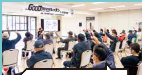
運転前のフィジカルチェック