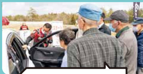
プロリードドライバーによる ドライビングレッスン