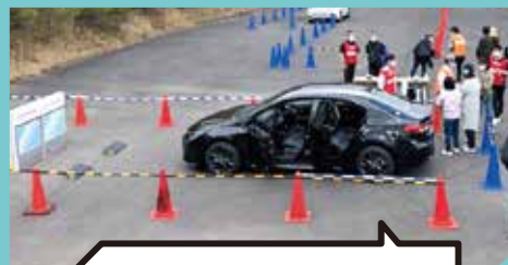
運転サポートカー乗車体験