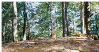
毛利元就がその生涯を過ごした、標高390m郡山の山頂。