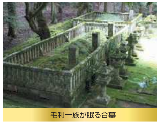
毛利一族が眠る合墓