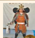
毛利元就 大将甲冑 20,000円