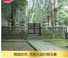
戦国武将、毛利元就が眠る墓