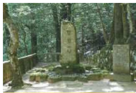
元就の逸話を伝える石碑