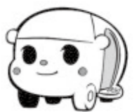
キャラクター名 あきたか太助（あきたかたすけ）

※ご利用者の皆様にはご不便をおかけしますが、何卒ご理解の程よろしくお願いいたします。