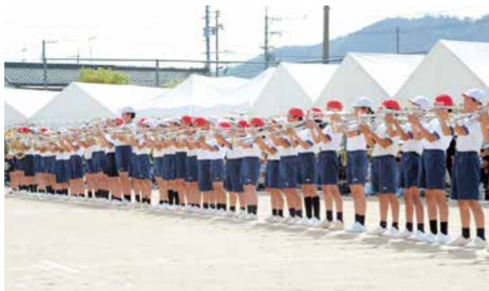
郷野小学校で長年親まれてきた金管演奏を、愛郷小学校の6年生全員で受け継ぎました。開会式前には、高らかにファンファーレを披露しました。

初夏を感じさせる暑さになった5月19日(日)、可愛小学校と郷野小学校が統合し誕生した愛郷小学校で、初めての運動会が開催されました。統合により全校生徒は204人に。グラウンドには児童や保護者の声援が響き、これまで以上の盛り上がりを見せました。