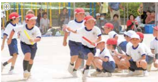
①白熱したリレーに児童も保護者も大盛り上がり ②5、6年生が魅せた力強い愛郷一心おどり ③④みんなで力を合わせて団体競技に挑みました