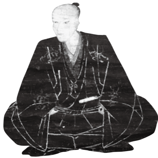
毛利興元画像(毛利博物館)