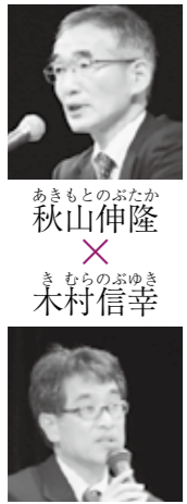
あきもと のぶたか 秋山伸隆 きむらのぶゆき 木村信幸

開場 12:00 開演 12:30 開会 13:00 終了 16:30 入場無料・申込不要 問合せ: 42-0070 (博物館) 【I】講演会 ・秋山伸隆氏(県立広島大学教授) 「毛利興元とその時代」 ・木村信幸氏(広島県教育委員会) 「興元時代の郡山城」 【II】対談「興元を語る」