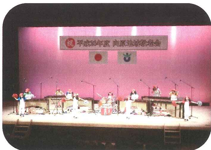
木琴演奏やダンス