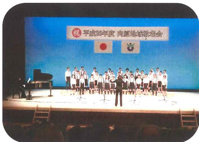
向原小児童による『合唱』