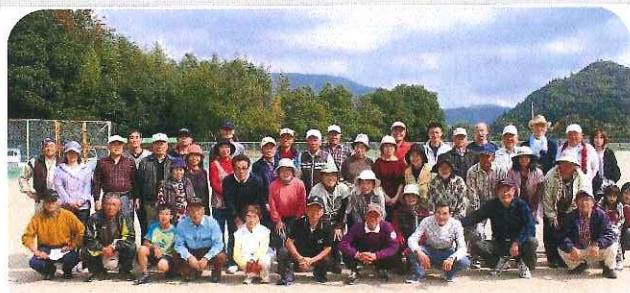
グラウンドゴルフ大会参加者の皆さん

平成26年10月26日（日）午前9時より、第11回グラウンドゴルフ大会が開催されました。当日編成された混成チームで、終始和気あいあいと和やかに楽しむことができました。