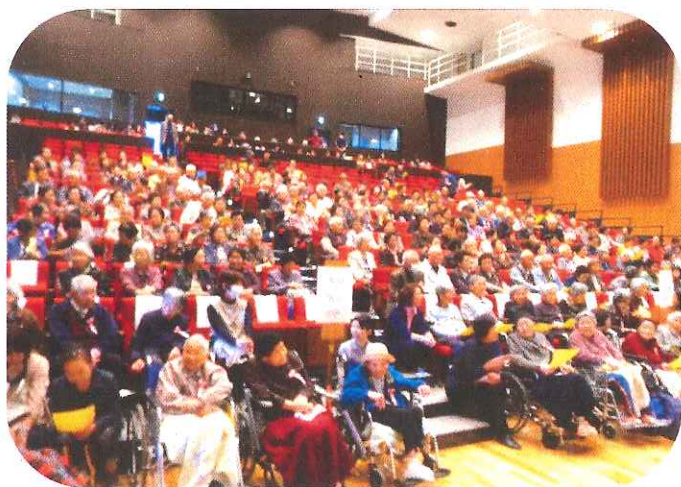
敬老会に参加された皆さん

平成26年10月25日(土)に向原生涯学習センターみらいにおいて向原地域敬老会が開催されました。こばと園児の太鼓や小学生の合唱、吉田高校神楽部によるや神楽などが披露されました。