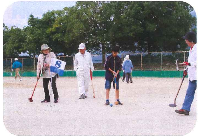
みんなで盛り上がりました!