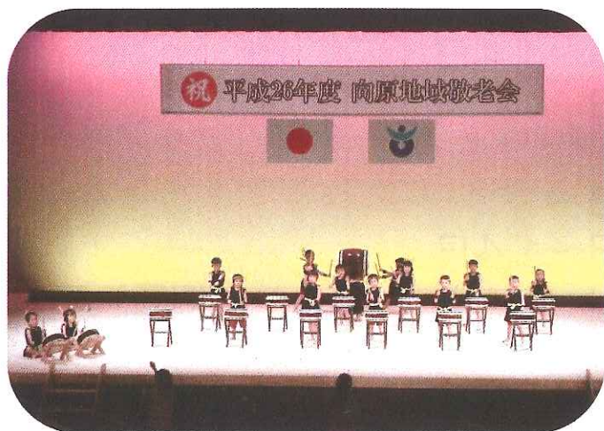
こばと園児による『こばと太鼓』