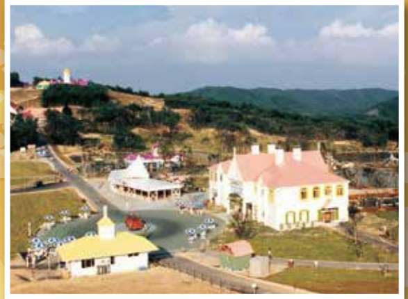
ニュージーランド村開園(平成2年)