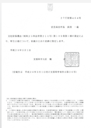
甲立古墳の国史跡指定の通知(平成28年)