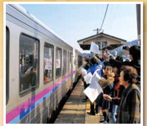
豪雨被害からの芸備線再開(平成31年)