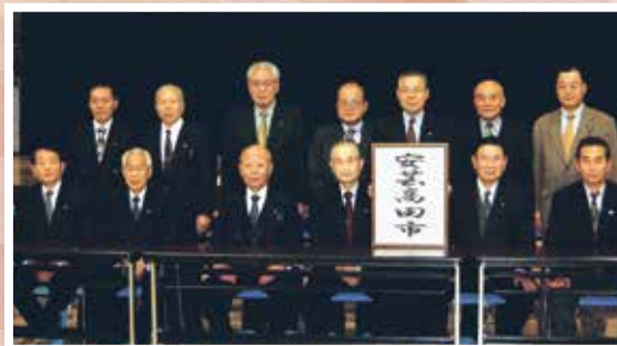
6町合併により安芸高田市誕生(平成16年)