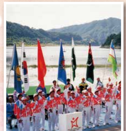
広島アジア大会(平成6年)