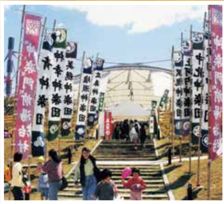
神楽門前湯治村オープン(平成10年)