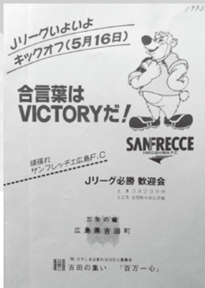
サンフレッチェ広島歓迎会パンフレット(平成5年)