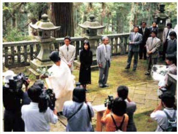
大河ドラマ「毛利元就」放映(平成9年)