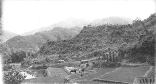
田屋城跡（昭和30年代頃） 戦国時代に中村氏の居城だったと伝わる城で、現在も中心部が残る