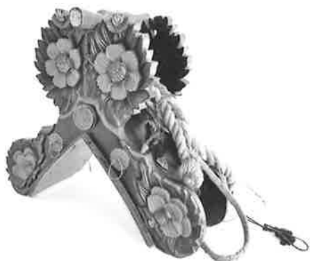
飾り鞍 土師でおこなわれていた花田植で牛に使われていたもの