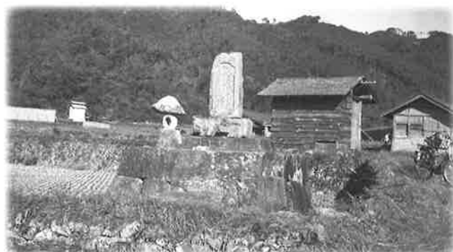
水没前の喉声忠左衛門墓（昭和30年代頃） 近世初頭に土師の灌漑用水を作ったと伝わる喉声忠左衛門の顕彰墓。現在は移転されている。