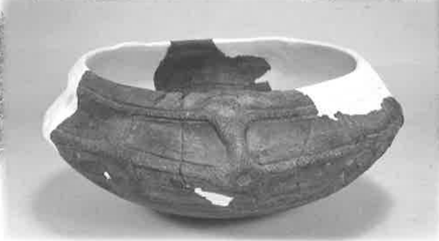
大迫遺跡出土浅鉢（縄文時代後期） 土壌の中から発掘された、埋葬用の埋甕と考えられている