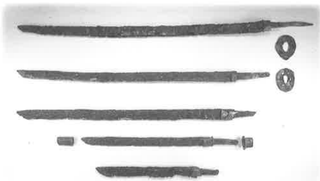
桑の木古墳出土鉄刀（7世紀前半） ダム建設に伴う発掘調査で全長9mの石室内から出土した鉄刀