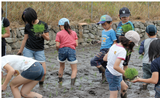
▲みんなで田植えガンバリました