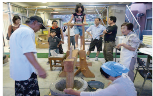
▲美味しいものが一杯でした

本当に暑い夏の夕ではありましたが、参加者の皆さんの交流は深まりましたね。地域にとっても、各地からの多くの人々との交流は大切なものです。