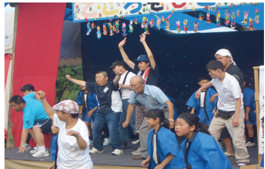
▲ステージも盛り上がりました