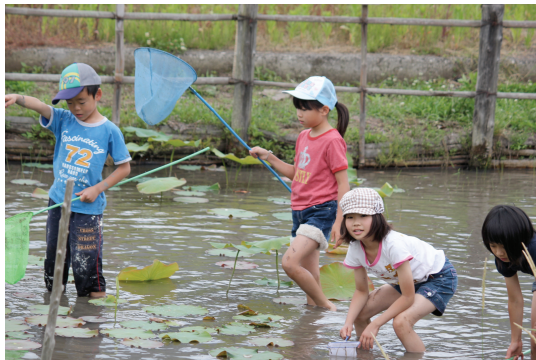
▲縄文の池をきれいにしました

今年も田植え、ピザづくり、メダカとりなど、子どもたちに大人の技を受信してもらいながら、手づくりの面白さを経験しています。