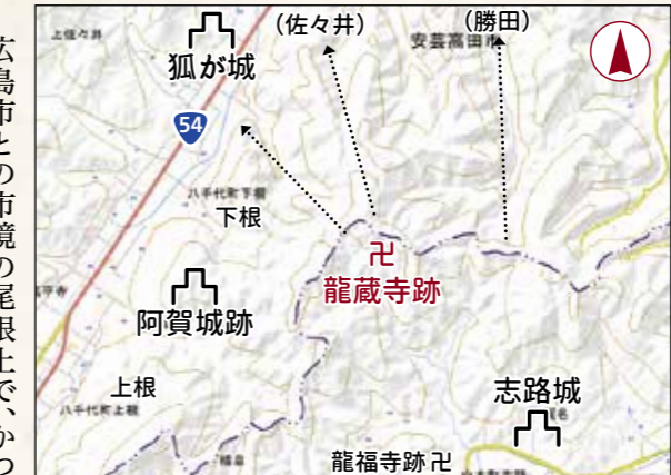
周辺位置図(国土地理院地図に加筆)

登山ガイド ・標高……550m ・比高……300m(下根側から) ・所要時間……登山口から20分