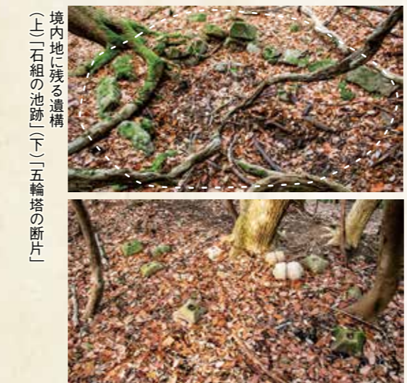
境内に残る遺構(上)「石組の池跡」(下)「五輪塔の断片」

広島市との市境の尾根上で、かつての下根、佐々井、勝田、志路の4つの村境が重なる山頂付近に位置します。周辺では最高地ですが、志路へはもちろん、下根・佐々井へ続く谷筋の道がそれぞれあります。また、東の尾根上には勝田へ続く道もあり、山奥でありながら交通の要所であったと言えます。