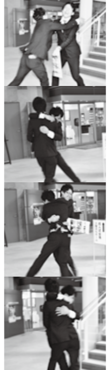
(写真上) 再会を喜ぶ友人と、熱い抱擁を交わす新成人

3. 個人番号カードを申請 希望される方は個人番号カードの申請書と返信用封筒を大切に保管して下さい。