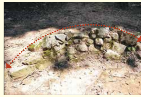
写真2 湾曲した謎の石垣跡(西側より撮影)