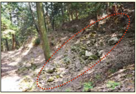
写真1 破却時に石を牽いた跡(南西側より撮影)

郡山城は山上にあり自然地形を活かしながらも、城内に家臣団を集住させ、中心部に石垣を築き、瓦葺き建物がありました。つまり戦国時代の軍事に特化した城から、江戸時代の政治・居住の場としての城へと移っていく過渡期のものです。この城は、発掘調査がされていませんが、①元就時代②輝元時代③江戸初期④幕末の要塞化計画期の4つの時期に改変があったことは確かです。これまであまり言及されていませんが、中心部には湾曲した石垣(写真2)や隅部が直角でない不自然な石列があり、これらは④の可能性があるかもしれません。