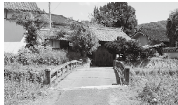
(写真上) 正面が住宅の中心主屋（母屋） (写真下) 敷地南正面の表門

この度7月17日の国の文化審議会での新たな登録文化財（建造物）の答申があり、甲田町の日野家住宅の建物7棟、工作物1件が登録文化財として選定されました。安芸高田市では昨年度の福泉坊（吉田町）に次ぐ2件目の登録文化財となります。 日野家は江戸時代には割庄屋を務めた旧家です。この日野家住宅の中心をなす主屋（母屋）は、近世民家の主構造を保持しつつ、近代住宅らしい洗練さと開放性を併せもつ大型住宅です。 その北側に並び建つ納戸倉、酒造倉は江戸時代中期の建築で、このほか米倉（昭和2年・1927年）、洋館（昭和11年・1936年）、御成門（江戸時代後期）が選定されました。 それぞれ長さ（桁行）22メートルの大規模な二階建土蔵です。漆喰塗りの長大な外壁、白壁が納屋とともに田園の中の屋敷景観を引き立たせています。また敷地南正面の表門は、広島吉田支藩の陣屋「御本館」（明治元年・1864年）の裏御門を移築したものです。