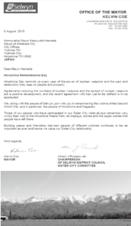
(写真上) メッセージ原文 (写真下) セルウィン町の雄大な自然

市は、ニュージーランドの南島にあるセルウィン町と、旧高宮町が平成4年に姉妹都市提携をし、以来長きにわたり友好関係を築いてきました。 その交流の一環として、毎年原爆の日には、平和メッセージの交換をおこなっています。 今年も戦後70年にあたり、核兵器廃絶や、恒久平和の尊さについて相互にメッセージを交換しました。また、8月には安芸高田市青少年海外派遣事業として、市内の中学生27名がセルウィン町のダーフィールドハイスクールの訪問し、ホームステイ体験や現地の生徒との交流活動を行いました。今後もますます両国・両市町の親睦友好の輪が広がるよう取組をすすめていきます。 【メッセージ訳文一部抜粋】 私たちはセルウィン町民は、安芸高田市民の皆さんと常に気持ちを共にし、第二次世界大戦、そして広島・長崎で尊い命を亡くされた方々を忘れません。 セルウィン町派遣団に参加した町民は、広島平和記念公園を訪れた時の事をはっきりと覚えていますし、そこでの展示や、語られたお話、そして多くの人々から送られた千羽鶴へこめられた祈りを忘れることはありません。 文化が異なる者同士が、これから先平和の構築を目指し、友好関係を深めてゆくことはこれまで以上に重要になります。 それゆえ、姉妹都市交流の継続も非常に大きな意味を持つと考えています。