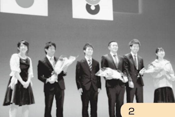
(写真下) 先輩成人のアドバイスに対して感謝の花束を贈呈する新成人たち

下の申請ができます。申請方法は主に2通りあります。 ①郵送で申請 個人番号カードの申請書に署名または記名押印し、顔写真を添付のうえ、返信用封筒に入れて郵便ポストへ ②オンラインで申請 スマートフォンで顔写真を撮影し、所定のフォームからオンラインで申請