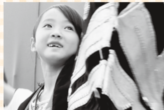
「目指せ！広島県子ども観光大使教室」で神楽衣装を身に付けて喜ぶ女の子(8月23日(日)撮影)

(メールで送られる場合は、件名に「すくすく離乳食教室申込み」と入力して、本文にお子さんの名前、月齢、アレルギーの有無、きょうだい参加有無(有の方は、名前、年齢)を入力してください。)