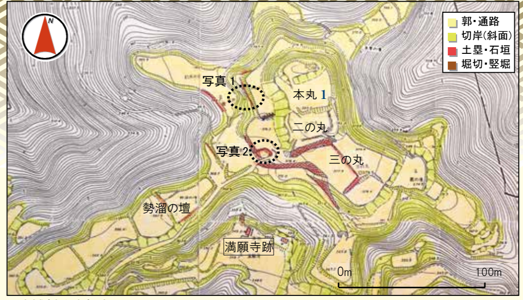
郡山城(中心部)測量図(「史跡毛利氏城跡保存管理計画策定報告書」より)

日本百名城に選ばれている郡山城は、全国から多くの人が見学に訪れます。その際、「もう城はないのでしょ?」とよく言われます。一般的に「城」は天守閣などの建築物という認識のようです。しかし、本来の城とは軍勢が籠るための空間全体のことです。建物の有無ではないのです。