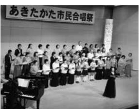
あきたかた市民合唱祭

ください。 日時 7月26日(日) 10:30~12:00 場所 たかみや人権会館 第7回 あきたかた市民合唱祭 生涯学習課 ☎42-0054 市内の合唱(コーラス)グループ8団体が、会場いっぱいに美しいハーモニーを響かせます。 フィナーレでは、来場者・出演者の全員で「線路は続くよどこまでも」「手のひらを太陽に」の2曲を大合唱します! 夏の大会にご参加ください。 日時 7月12日(日) 13:00 開場 13:30開演 場所 高宮田園パラッツォ 入場料 無料 出演団体 (出演順) ・船木ゆめコーラス