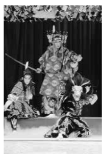
国際交流会 Party (パーティ)

運行します。会場周辺は、混雑が予想されますので、シャトルバスをご利用ください。 第5回高校生の神楽甲子園 ひろしま安芸高田 商工観光課 ☎47-4024 今年も、神楽門前湯治村神楽ドームに、全国15校から神楽を愛する高校生が集まり、地域に伝わり、先人から受け継がれてきた神楽を披露します。 日時 7月25日(土)・26日(日) 9:00開門 10:00開演 場所 神楽門前湯治村 神楽ドーム 運営協力金 大人1,000円、高校生以下無料 (当日券のみ・全席自由) Potluck (ポトラック) 国際交流会 Party (パーティ) 人権多文化共生推進課 ☎42-5630 それぞれ料理を持ち寄り、