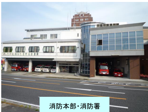
消防本部・消防署