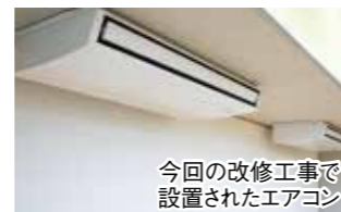
今回の改修工事で設置されたエアコン