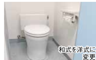
和式を洋式に変更