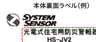
本体裏面ラベル(例)

型式:電池方式、2種(DC3V、300mA) 自動試験機能付 型式番号:住警第26~55号 使用電池:Panasonic CR-2/3AZ 設置位置:天井面・壁面 製造年:2018-02製 中国製造 製造番号:XXXXXXXXXXXX 製造元:ハネウェルジャパン株式会社 ライフ・セーフティ事業部 電話番号:03-6730-7354 HP: http://honeywell.com/sites/jp NO4-2901-001