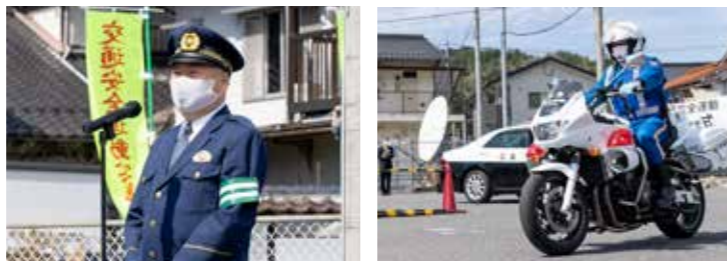
出発式であいさつをする横田安芸高田警察署長

4月6日(火)から15日(木)まで実施した「春の全国交通安全運動」初日の6日、安芸高田市交通安全運動推進隊と安芸高田警察署が合同で安全安心パレードを行いました。