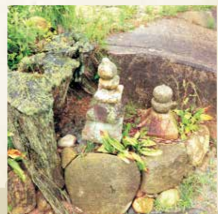
周辺に残る五輪塔

このコーナーは市内のいろいろな出来事を紹介するコーナーです。皆さんの身近な出来事をお知らせください。