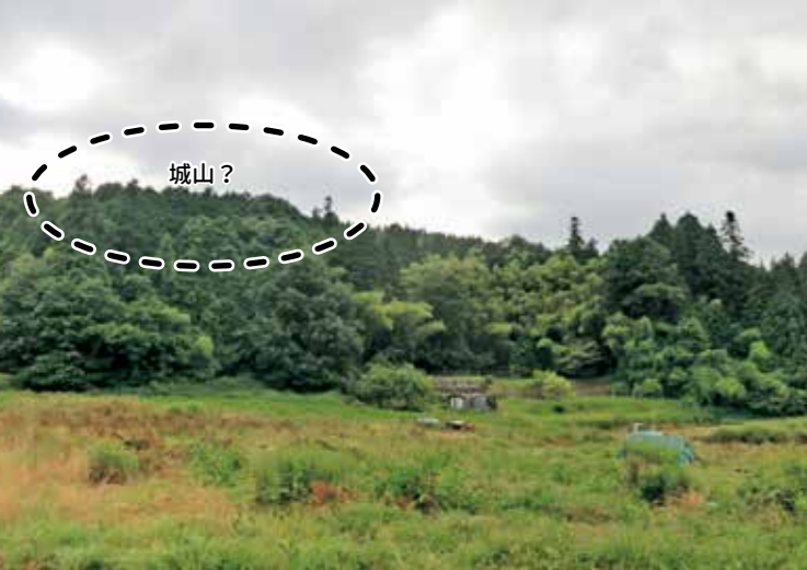
伝「権崎城山」遠望(東側の阿弥陀堂より撮影)