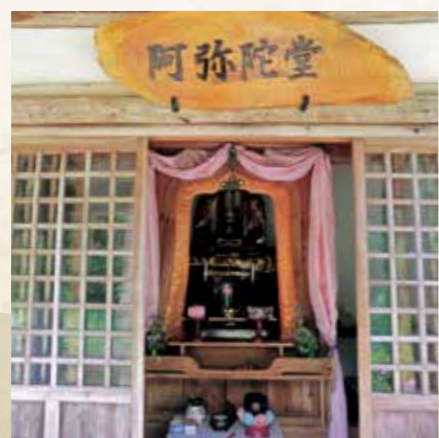
寺跡付近の阿弥陀仏(当初は6体あったとも伝わる)