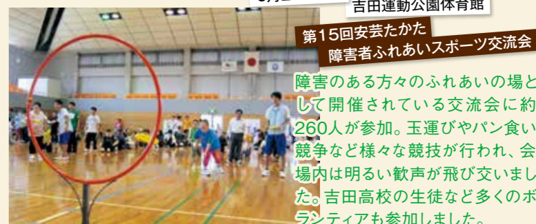
6月24日(日) 吉田運動公園体育館 第15回安芸たかた 障害者ふれあいスポーツ交流会

障害のある方々のふれあいの場として開催されている交流会に約260人が参加。玉運びやパン食い競争など様々な競技が行われ、会場内は明るい歓声が飛び交いました。吉田高校の生徒など多くのボランティアも参加しました。