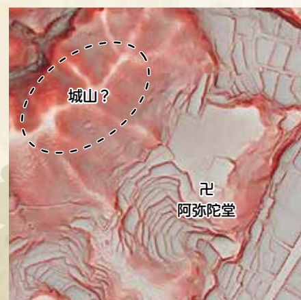
航空レーザー測量図

現在地 阿弥陀堂のある場所は、牧草地となっていますが、戦後の写真では耕地になっており、城跡らしき痕跡はありません。さらに西側の山上についても航空レーザー測量図からは、城跡らしき地形は見当たりません。よって現状からは、城跡であるかは不明です。一方で寺跡については、周辺に五輪塔が多数残っており、阿弥陀仏像も現存することから、記録が裏付けられています。 その後の冠念寺 寺は江戸初期に三丘(山口県周南市)に移り、明治4年に合併して現在の光市岩田に移転しましたが、寺名は冠念寺として存続しています。