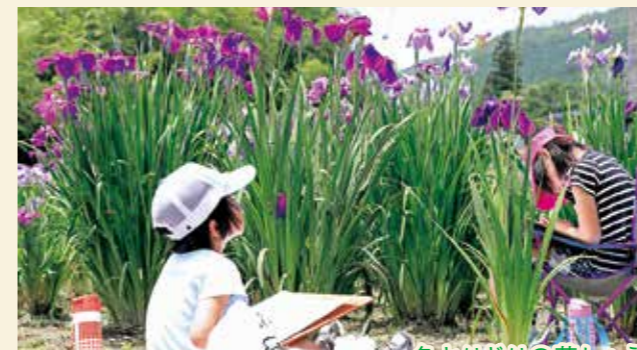
6月9日(土)、10日(日) 向原花しょうぶ園 花しょうぶまつり

神事が行われたのち3頭の飾り牛や早乙女など100名を超える演者が入場。目の前で繰り広げられる華やかな歴史絵巻を、市内外から集まった観客が楽しみました。