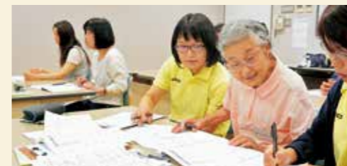
6月2日(土) クリスタルアーヂョ 要約筆記奉仕員養成講座

要約筆記奉仕員とは、難聴や聴覚障害のある人で手話の分からない人のために要約筆記を行う通訳者のこと。この奉仕員を養成する講座が開講しました。参加者は、平成31年2月まで全16回の講座を受講します。