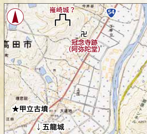
周辺位置図(国土地理院地図に加筆)

シリーズ「お城拝見!」第79回 さいざき 伝権崎城山(冠念寺跡) 《甲田町下甲立》