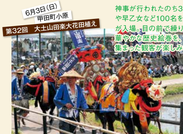
6月3日(日) 甲田町小原 第32回 大土山田楽大花田植え

要約筆記奉仕員とは、難聴や聴覚障害のある人で手話の分からない人のために要約筆記を行う通訳者のこと。この奉仕員を養成する講座が開講しました。参加者は、平成31年2月まで全16回の講座を受講します。