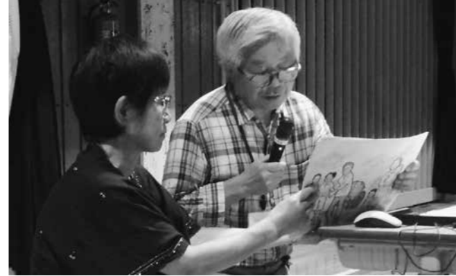
毎年行われている語り部。昨年度は、原爆により家を失った広島の人々のために、家を建てる活動をされた米国のプロイト・シュモー氏の絵本の読み聞かせが行われた。