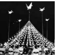
平和の灯の集いが立ち上げられた頃に作られていた平和の灯のタワー