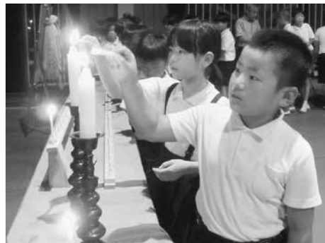
平和への祈りを込めて火を灯す児童たち