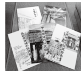
下3冊が絵本、左上が資料集、右上が絵本と資料集のカバー

「この資料集と絵本を発刊するきっかけになったのは、『甲田町ふるさと運動実行委員会』が35年前に編集・発行された本『甲田町のむかしばなし』を甲田図書館で見つけたことでした。この本は、約9年間かけて甲田町の民話・伝説を聞き取りなどで調査し、まとめられたものなのですが、大変貴重な資料であるこの本を、なんとかして次世代に伝えたいと思い、情報をより整理した資料集と、子どもが読んでもわかりやすい絵本の編集に取り組みました」