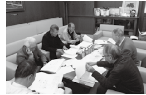
編集会議を行う様子

公益社団法人 日本河川協会は河川に対する国民の理解を得るため、毎年功労者表彰を行っており、5月25日(月)土師ダム桜守プロジェクトが東京都千代田区砂防会館別館において表彰されました。当団体は地域住民との協働により、桜の剪定・周辺の除草・清掃活動等桜の維持管理を行うことにより、土師ダム湖畔のイメージアップや集客に努められるなど地域の活性化に尽力されています。おめでとうございます。