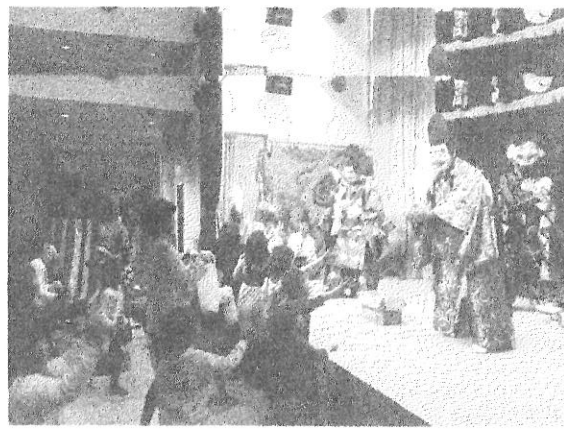
下佐の皆さんのご健康とご多幸を 今年もお祈り申し上げます。

参加される方及びタクシーご利用の方 後日振興会地区役員が呼びかけします 野部中尾宅前：10:00 所木集会所前：10:25 信木集会所前：10:30 三田谷：10:40 式敷駅前：10:40 名倉：10:45 タクシーご利用者の都合で多少時間の変動があります