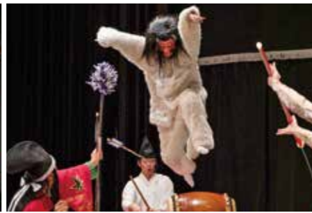
高猿神楽団「源頼政」