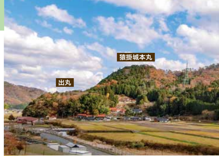
多治比猿掛城遠望(西側日南地区から撮影)