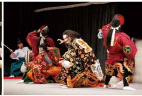
八千代神楽団「紅葉狩」