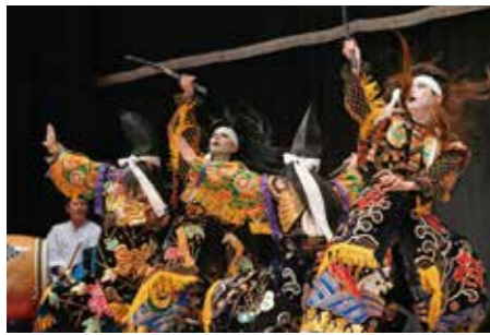
吉田神楽団「厳島合戦」

「吉田神楽団」「高猿神楽団」「八千代神楽団」が3年ぶりに開催された共演大会で迫力の舞を披露。新作の演目もあり、市内外から集まった多くの神楽ファンからは惜しみない拍手が送られました。