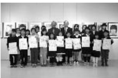
昨年の表彰者のみなさん

■開館時間 午前10時～午後5時 ※火曜日休館 ■入場料 無料 ■第2回安芸高田市児童生徒自画像展 2月2日(水)～2月21日(月) 市内全小中学校から自画像を募集し、入選作品を展示。