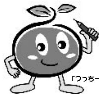
「つつー」 2005年農林業センサ

農林水産省では、平成17年2月1日現在で、「2005年農林業センサ」を実施します。この調査は、我が国の農林業・農山村地域の実態を明らかにする最も基本的な調査で5年に1度行われています。 1月下旬から調査員が農林業関係者の方々を訪問して、調査票に農林業の経営状況などの記入をお願いします。 調査票に記入された事項については、統計以外の目的には使用されませんので、ご協力をお願いします。