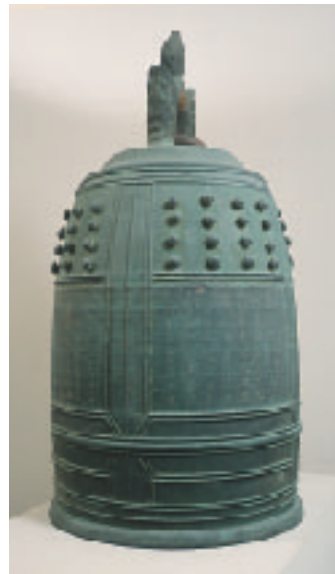
▲写真2 吉田高林坊梵鐘(県重文) 銘文に、もと甲立石室寺の梵鐘と刻まれています。宍戸氏が陣鐘に用いたとも伝えています。