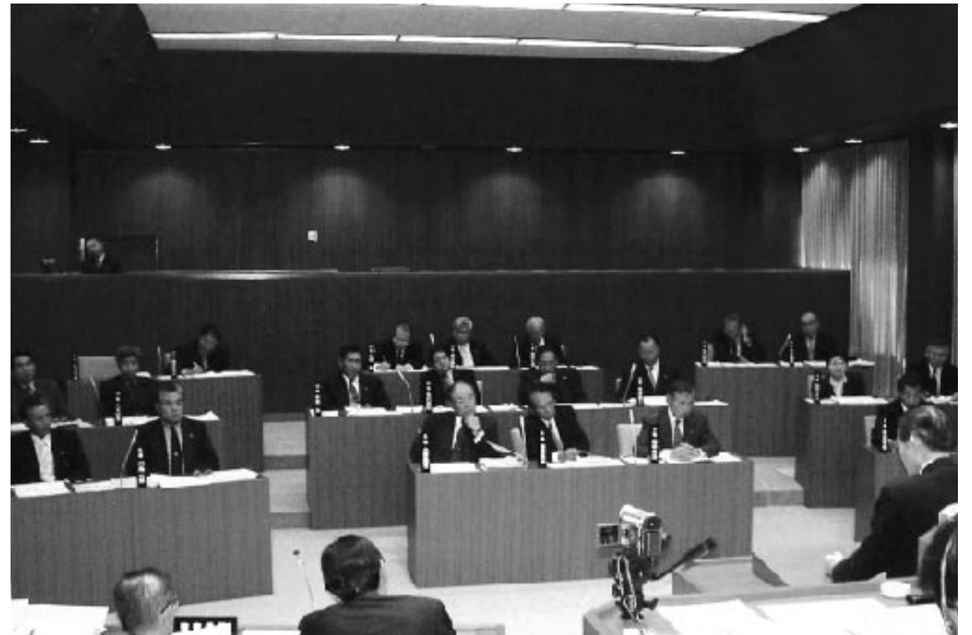
▲平成15年度決算は、新しい議会体制となってはじめての12月定例議会で審議されました。