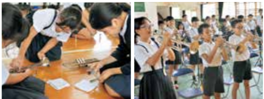
可愛小学校の5年生はトランペットに興味津々。郷野小学校の児童の説明に、真剣に耳を傾けていました。

統合に向け両小学校の児童同士の交流を図るため、1年を通して様々な事業が計画されています。6月14日には学年ごとに社会見学を実施。また、郷野小学校の4~6年生で構成される伝統的な金管バンドが、来年度には可愛小学校の現5年生も参加することになったことから、7月には郷野小学校の児童が可愛小学校を訪れ、金管楽器の吹き方や手入れの仕方などをアドバイスしました。今後も、5年生の合宿や4年生の授業交流などが予定されています。