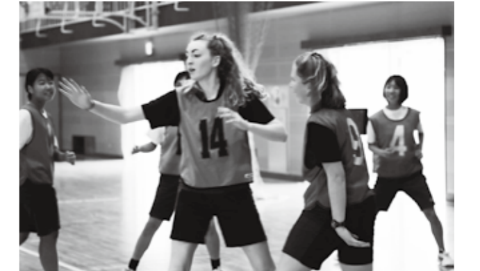
吉田中学校にて体育の授業の様子