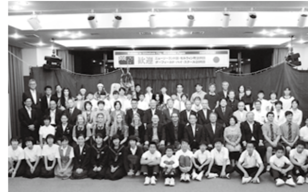
歓迎レセプションに参加した訪問団、ホストファミリーのみなさん、市長、派遣団に参加した中学生、他

9月25日から9月30日の5泊6日で、ニュージーランドセルウィン町にあるダーフィールドハイスクールから8名（生徒5名・引率者3名）、町民1名、計9名の訪問団が来られました。 セルウィン町とは1990年に、市合併前の高宮町が国際交流を目的に姉妹都市を結び、現在も市と交流が続いています。 なお、今年の8月には約1週間、市内の中学生20名で構成された派遣団が、セルウィン町でホームステイを中心とした語学・異文化体験を行いました。 この度訪れた訪問団は、吉田中学校で生徒と共に授業を体験したり、歴史民俗博物館にて、市の歴史を勉強されました。 また、クリスタルアージュで開かれた歓迎レセプションでは、ホストファミリーや8月の派遣団も参加し、交流を深めました。また、美土里中学校神楽同好会が「武蔵ヶ原」を実演し、市の伝統芸能の神楽を紹介しました。訪問団の方々は「日本文化に触れることができた。また日本にきたい。」と笑顔で感想を述べられています。