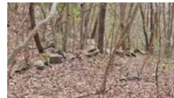
謎の石列 (北側より撮影)