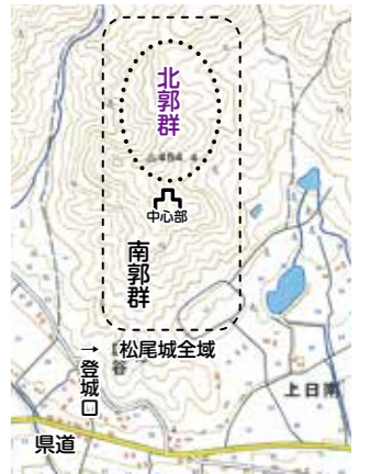
位置図(国土地理院標準地図に加筆)

立地 今回新たに確認したのが、中心部北側及びその東に派生する尾根上の遺構で、そのほとんどが標高400m以上です。さらに、中心部の東西にも広範囲に平坦地を確認しました。