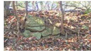
北郭群石積 (東側より撮影)