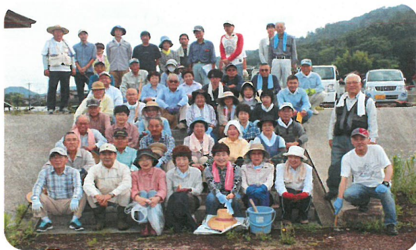
尾原親水公園の草取りに参加頂いた地域の皆様 ご協力ありがとうございました！