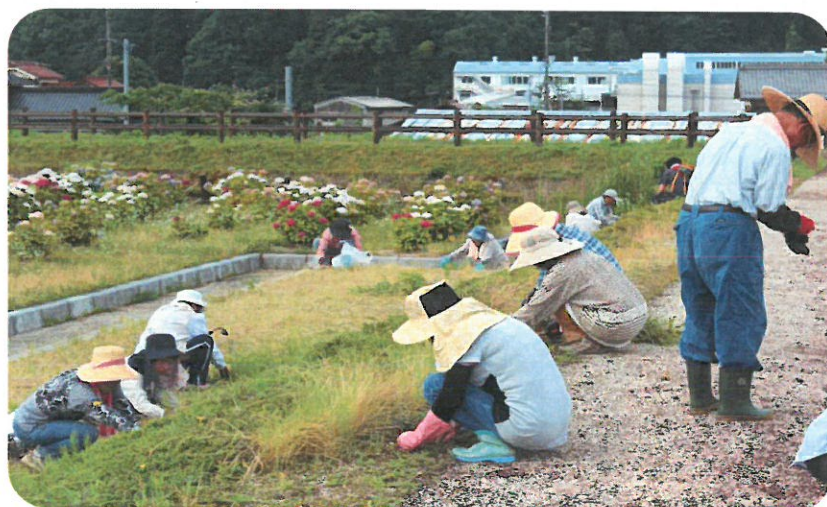
草取り作業中の皆さん

終わりに、地域の皆様には、今後も振興会の運営に際して、さらなるご支援ご指導をお願い申し上げます。