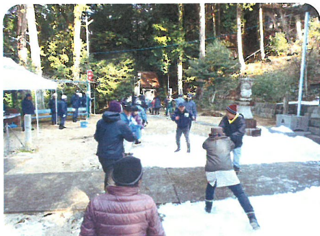
地域の皆さんによるバケツリレー

1月22日（日）に国貞山神社において文化財保護訓練が行われました。国貞山神社での火災発生を想定し、地域の皆様・消防署・消防団で連携し、バケツリレーなどの消火訓練を行いました。ご協力ありがとうございました。