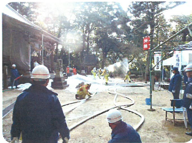
消防署・消防団による消火訓練