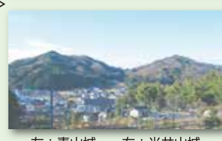
左：青山城 右：光井山城

郡山合戦時に風越山城を本陣とした尼子氏が郡山城に対峙して築いた陣城。両城とも4ヶ月間の使用とは思えない多数の郭群が全山に渡り築かれている。