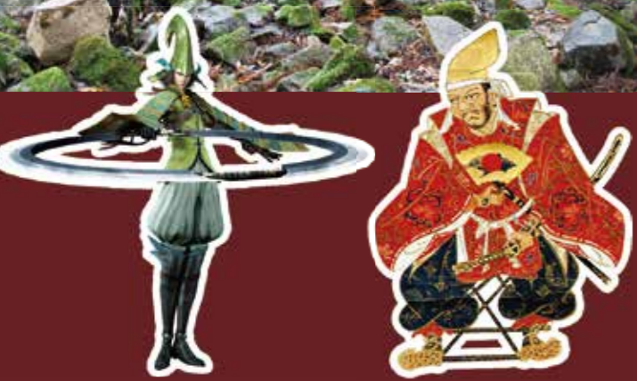
「戦国BASARA」シリーズより 毛利元就