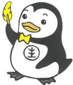
更生保護イメージキャラクター-更生ペンギンのホゴちゃん

また、保護司会と連携して、更生保護施設や矯正施設の訪問や研修、ミニ集会などを実施し、地域に根差した明るい社会づくりを推進します。