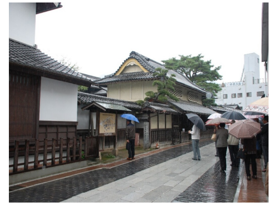
唐城風の屋根で贅をつくした商家

入りし、小早川家の当主となったことから毛利氏ゆかりの地である。江戸時代、製塩業、酒造で栄えた町で、豪商の館を中心に町並みが形成されている。