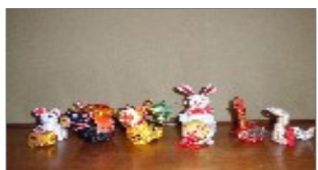
子 丑 寅 卯 辰 巳