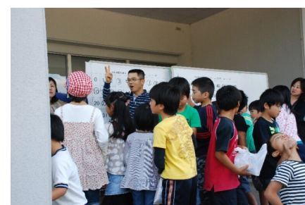
こどもビンゴゲーム