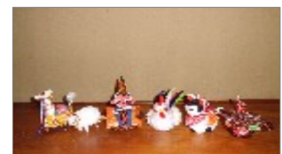
午 未 申 酉 戌 亥

毎月一度、会員とボランティアが集まって「遊び」「語り」「食し」楽しいひと時をすごしています。この事業は、平成11年の翌年から始まる介護保険で「自律」と認定された方を対象とした「デイサービス」としてはじめての事業です。いまでは、丹比地区の地域福祉の「環」として「丹寿会」という愛称で親しまれ、活動しています。現在の会員は52人で、物を作りながら、おしゃべりをし、できばえを楽しみむ手芸や、輪投げ、カローリング、クラウンドゴルフなどの軽スポーツに興じるひと時もあります。