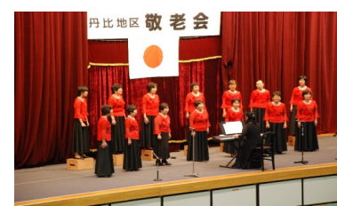
合唱 コーラスグループ銀河