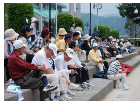
チームの応援をする観客(選手)