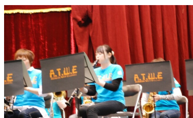
吹奏楽 安芸高田ウインドアンサンブル