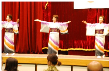
民謡 民謡研究会丹比分会