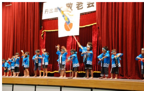
おどり 吉田幼稚園