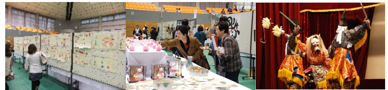
吉田幼稚園児の絵