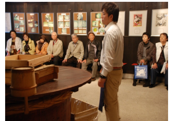
お酒の試飲前に酒造りのウンチクをきく参加者

なかも、毎年11月の「干支」づくりは、昨年で12干支を作り終えました。65歳以上で、介護認定を受けておられない方なら、どなたでも、いつでも入会できます。ご入会をお待ちしています。