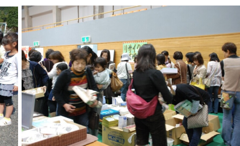
リサイクルバザー