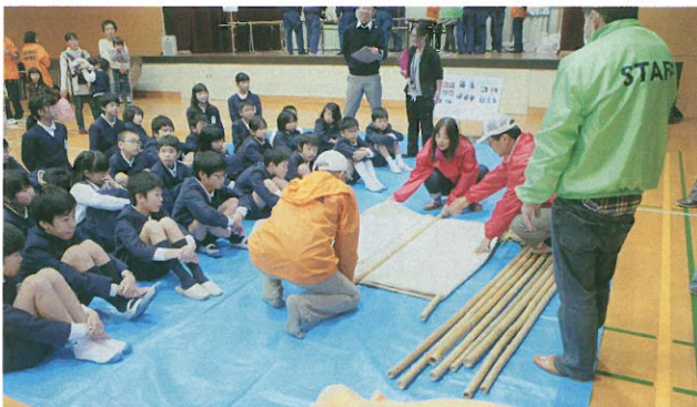
上側・竹竿2本と毛布による簡易タンカの作り方を学ぶ