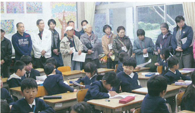
上側・吉田地区の視察参加者。「地震が発生したら、まずどうするか」の授業参観。