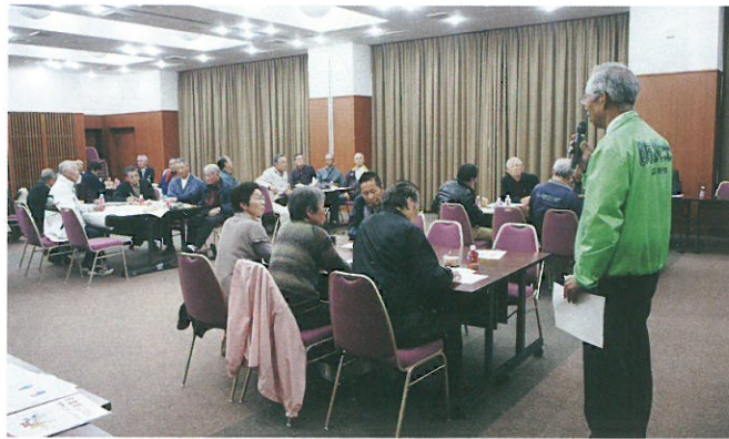
減災のための備えなどについての講演を聴く

安課の職員及び安芸高田市危機管理課の職員を迎え、講演を聴いたりワークショップなどを行いました。