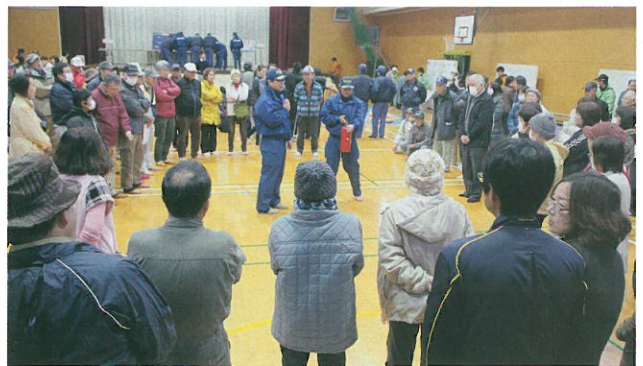
上側・消火器とAEDの使い方訓練。いざという時の為に、頭の中へしっかり入れておく。