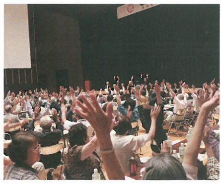
広島カーブ優勝 バンザーイ!! の掛け声で盛り上がる会場の皆さん