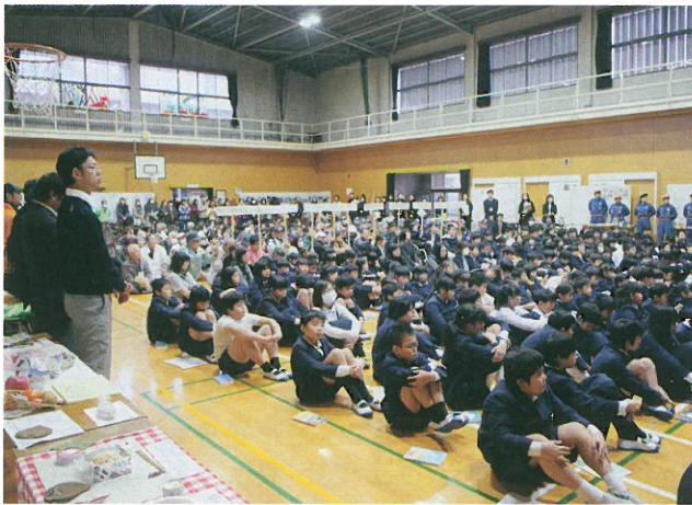
右側・避難した地域住民。避難者数の報告・挨拶の後、各展示コーナーの資料で学ぶ。