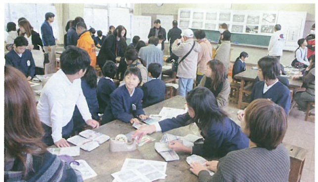
上側・避難所で使う上履きを、新聞紙で作る。チラシで皿も作る。