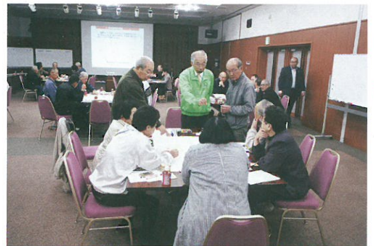
ワークショップで地域内の危険箇所や避難の方法などについて話し合う

①災害が発生した時、減災について事前に準備している地区は被害が小さいが、取り組みをしていない地区は各自がバラバラに行動し被害が大きくなる。