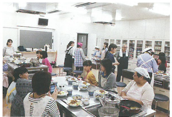
『自分たちで作った料理は美味しかったです。』

10月22日(土)午前10時より、クリスタルアーシヨに於いて子ども料理教室を開催しました。今年度は、子どもの参加者が年々減ってきたので親子での参加も可能にし、保護者6名、吉