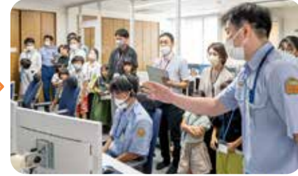
消防本部の通信指令室や市役所内を見学しました。