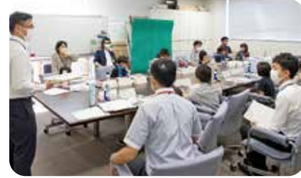
市役所の仕事の説明を聞き、市に関係するクイズにも挑戦しました。