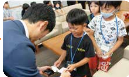
市長、副市長、教育長と名刺を交換。緊張した面持ちでしたが、上手にあいさつをして渡すことができました。