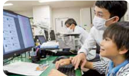
パソコンを使って名刺を作成。「たかたん」のイラストも貼りました。