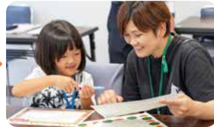
最後に、家族(職員)への手紙を作成。「いつもありがとう」など感謝の言葉に笑顔があふれました。