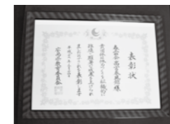
春霜会・高宮春風館

高宮町内で長年にわたり青少年育成を目的に剣道の修練を行い、多くの剣道大会に参加するなど精力的に活動され、近年では、広島県内の大会において好成績をあげられています。また、OBが指導者として根付くなど伝統がはぐくまれています。このことが評価され、広島県教育委員会より体力づくり優良団体表彰を受けられました。