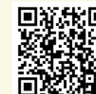
▲詳しくは市ホームページ

市のスポーツ振興の拠点、安芸高田市サッカー公園の整備に関わる寄附金を受け付けています。