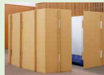
段ボール間仕切り